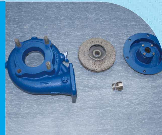
elementy pompy po remoncie

Jeśli macie Państwo nietypową pompę wirową, prosimy o kontakt, mamy wiedzę i doświadczenie także w rozwiązaniach niestandardowych.