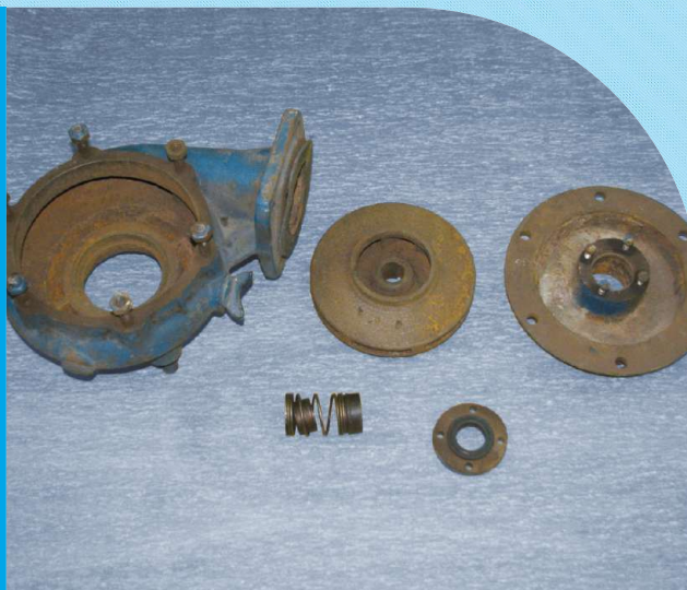
elementy pompy przed remontem

Dysponujemy mobilnym zespołem serwisantów, który może wykonać wiele prac na miejscu, u klienta, natomiast w przypadku kompleksowego remontu, pompy są przesyłane do naszego zakładu.