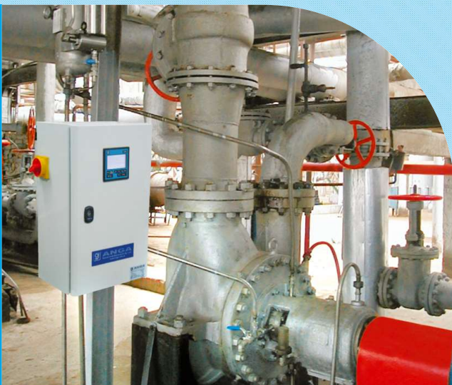
pompa z uszczelnieniem i instalacją ANGA

Zakres współpracy może być elastycznie dostosowany do wymagań klienta. Na podstawie analizy warunków pracy pomp, możliwe jest wdrożenie programu zarządzania pompami klienta wraz z magazynem części.