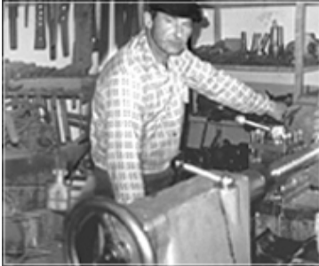
początki firmy ANGA