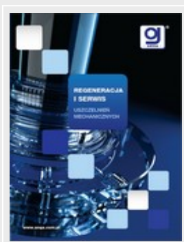
Folder "Regeneracja i serwis" (pdf)