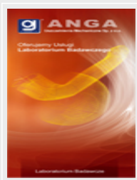
Folder „Laboratorium badawcze” (pdf)