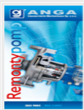
Folder „Remonty pomp” (pdf)